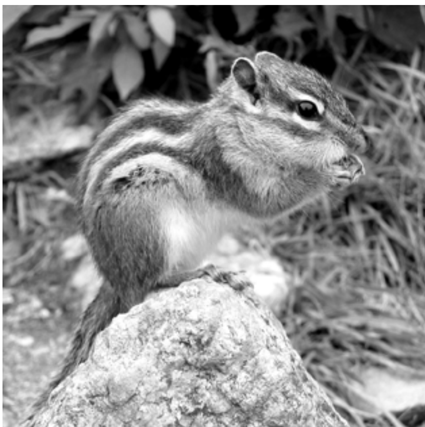
西伯利亞花栗鼠（ Tamias sibiricus ）。

鼯鼠英名 flying squirrel，可從高處滑翔到低處。台灣有 3 種，以分布中低海拔地區的大赤鼯鼠最常見；白面鼯鼠分布中高海拔地區，也不稀奇；小鼯鼠分布中海拔地區，數量較少。二、三十年前，風景區的紀念品店普遍販售鼯鼠標本，白面鼯鼠較大