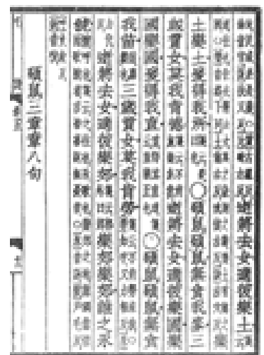
《詩經 魏風 碩鼠》，詩人以鼠喻人，對統治者和剝削者提出深沉的控訴。

小黃腹鼠身長 13~17 公分，體重 80~120 公克，是野外最常見的鼠類，一般所說的田鼠，就是指牠們。月鼠，又名田鼯鼠，也是野外常見的田鼠之一，身長 7~8 公分，體重 12~20 公克，穀物收割後常侵入住宅，被誤認為小家鼠。黑帶鼠(又稱赤背條鼠)，身長 7~10 公分，體重 20~40 公克，背部有一條深色縱帶，和其他鼠類很容易區分。