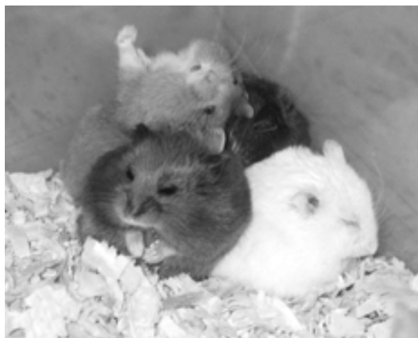
四種不同毛色的坎培爾侏儒倉鼠。

敘利亞倉鼠俗稱黃金鼠，亦即卡通中的哈姆太郎，英名 Syrian hamster，學名 Mesocricetus auratus ，身長12.5~17.5公分、體重85~150公克，