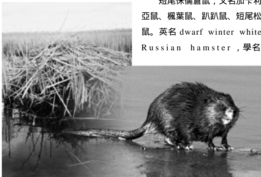
麝鼠及其水中的巢，由兩張圖片以電腦合成。

短尾侏儒倉鼠，又名加卡利亞鼠、楓葉鼠、趴趴鼠、短尾松鼠。英名 dwarf winter white Russian hamster ，學名