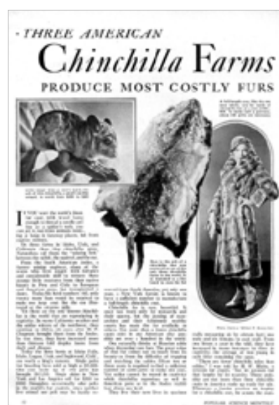
1933 年 12 月號著名科普雜誌“Popular Science”刊出有關栗鼠的養殖報導。

chinchilla，有兩種——長尾栗鼠( Chinchilla lanigera )和短尾栗鼠( C. brevicaudata )，原產南美安地斯山區。身長 25~35 公分，體重 400~600 公克，毛質呈絲絨狀，每一毛囊的毛髮可達 60 根，其緻密可想而知。自 16 世紀起，即被視為皮貨珍品，短尾栗鼠皮尤其珍貴。栗鼠已列為華盛頓公約第一類保護動物，禁止在國際間交易，養殖者亦不例外，因而價格昂貴，可能居各種皮貨之首。