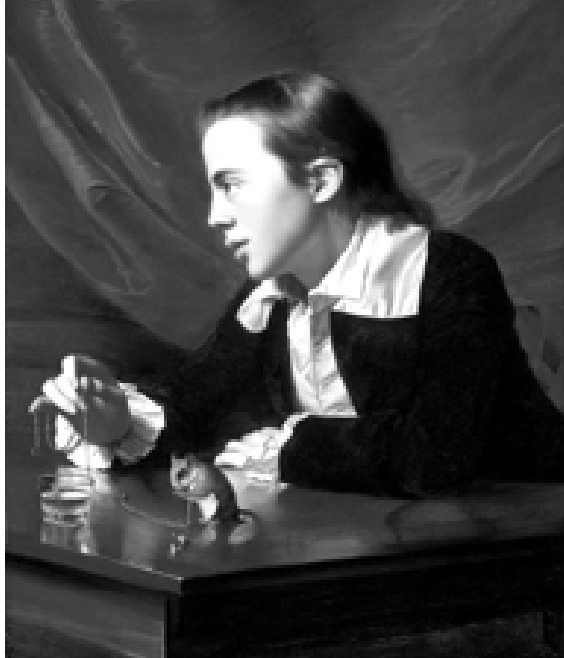
男孩與鼯鼠，美 John Singleton Copley 繪，1765年，波士頓美術館藏。以鼯鼠作寵物者不多見。

人，是最廉價、最容易飼養的寵物鼠。飼養箱（籠）中通常置有旋轉輪，讓牠們奔跑、活動。市售的寵物松鼠，幾乎都是赤腹松鼠。飼養松鼠，最好從還沒睜幼眼的幼鼠養起，動物有所謂銘印現象，對第一眼所看到的事物印象特別深刻。當然嘍，松鼠不是家畜，不可能養熟，牠們長大後喜歡咬東西（磨牙），一不小心就可能被牠咬傷，除非經過訓練，最好不要取出把玩。