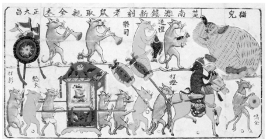
民間傳說，大年初三老鼠娶親，這天要提早熄燈休息。圖為清代湖南隆回年畫，深具漫畫意味。

黑鼠和褐鼠都過群居生活，每群老鼠中都有幾隻特別厲害，其他老鼠都要讓牠，如不肯讓，就會打上一架。筆者讀高中、大學時，台灣的經濟還很落後，一般人家都住簡陋的平房，常被天花板上的追逐聲吵醒，接著傳來